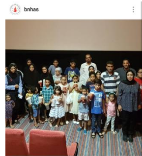
Liked by koka_444 and 27 others bnhas رحلة العودة الى المدارس 16 سبتمبر 2017 SEPTEMBER 16 - SEE TRANSLATION