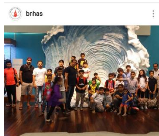
Liked by koka_444, fluteplayer81 and 30 others bnhas رحلة عيد الاضحى الى حديقة واهو المائية متواجدين حاليا 8 سبتمبر 2017 لتسجيل الدخول